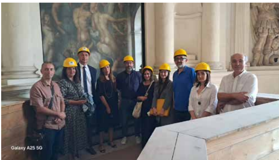
Galaxy A25 5G